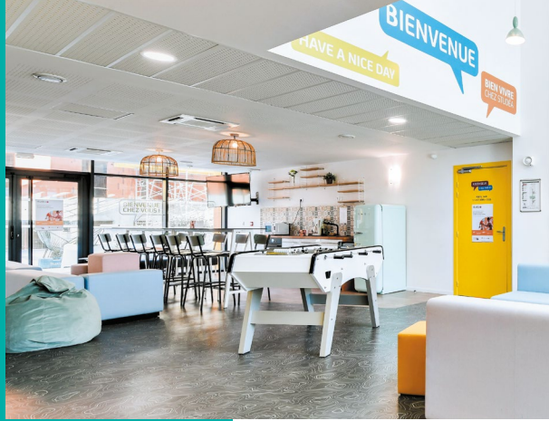
Toulouse Purpan, « Résidence Studéa », architecte : DR